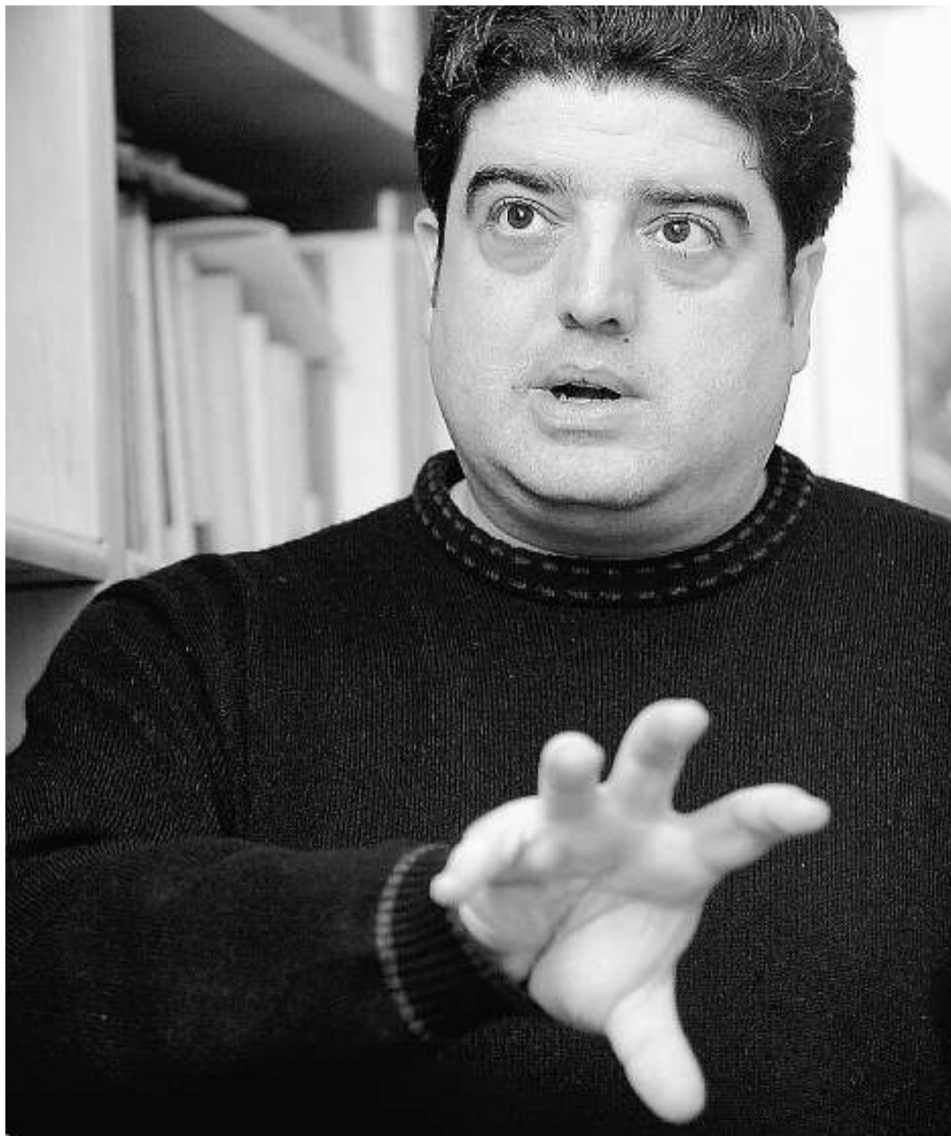
L'autor de «No mos fareu catalans», també dedica un capítol a l'anticatalanisme a les Balears i a Aragó.

— «No crec que Eliseu preferisca un país governat pels