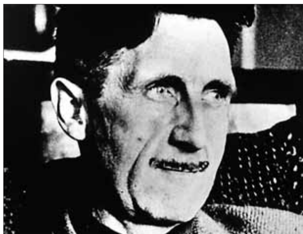
El periodista i narrador George Orwell.