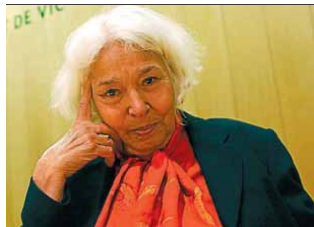
L'autora egípcia Nawal El Saadawi.

És Companys, però, qui, amb la seva erràtica trajectòria, dóna la mesura de les limitacions del projecte republicà, que certament va fer possible a Espanya una experiència democràtica i a Catalunya el recobriment del poder autònom, però que ben aviat va veure com les dificultats del trànsit del vell ordre monàrquic a la democràcia frustraven les seves ànsies d'emancipació i progrés.