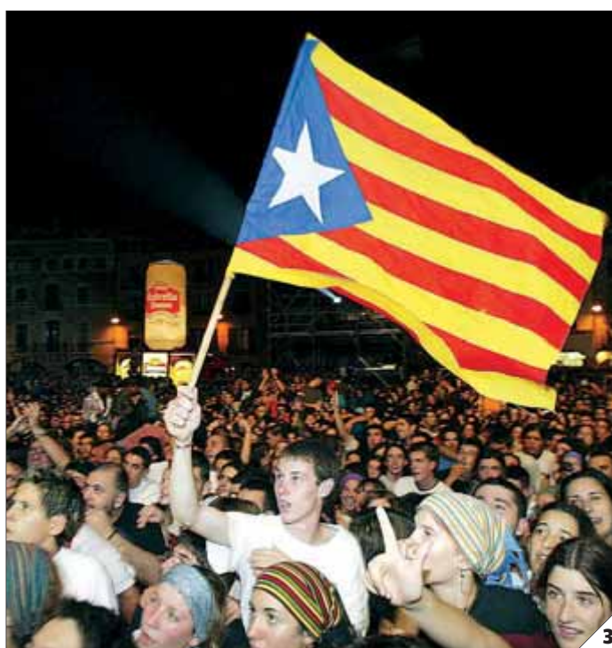
Nens amb estelades durant una jornada lúdica i reivindicativa de les llibertats nacionals a Barcelona Exemplar del llibre escrit per deu pensadors catalans Públic jove durant un concert al Mercat de Música Viva de Vic

dels seus territoris i de les seves fronteres, justament es configuren per marcar els límits de la solidaritat. Canviar d'Estat significa desplaçar les obligacions de solidaritat. En la Catalunya independent no hi hauria transferència de rendiments tributaris cap a Espanya ni en un 50%, ni en un 35% ni en un 15%. Zero seria la rutilant quantitat que compondria, en el moment de l'esqueixament definitiu, les nostres obligacions financeres cap a l'administració veïna".