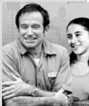
rá fundamental; pero más aún lo será la visita que hará a la cárcel de mujeres de Greenwich Village, donde conocerá a una presa (Erikah Badu). Todo, ambientado en Nueva York.

El actor David Duchovny, muy conocido por su papel del agente Mulder en la serie Expediente X , debuta detrás de la cámara con esta comedia dramática, en la que también tiene un papel, que cuenta la historia de Tommy, un adolescente que vive con su madre soltera (Tea Leoni, a la sazón esposa de Duchovny). La amistad del joven con el conserje del instituto, una persona algo retrasada, que encarna Robin Williams, se-