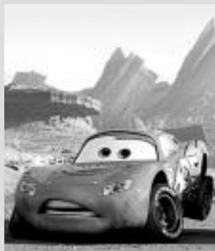
Copa Pistón. El protagonista acaba en Radiator Springs, un pueblo fantasma de la olvidada Ruta 66, en el que conocerá a una serie de personajes singulares. Muy aconsejable.

John Lasseter, el director de éxitos como la revolucionaria Toy Story —sus dos partes—o la estupefanda Bichos , vuelve a la carga con Cars , la última creación del estudio de animación Pixar. La historia, contada como es habitual con grandes dosis de humor para grandes y pequeños, está centrada en Rayo McQueen, un ambicioso coche de carreras que se pierde en su camino a la carrera final que debe proclamarle campeón de la