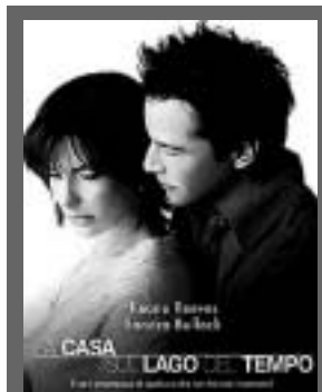
Director: Alejandro Agresti Intérpretes: Keanu Reeves, Sandra Bullock Género: Drama romántico Nacionalidad: EEUU

La trama de La casa del lago apunta a vectores ultraclásicos pero, por ello, menos intrigantes. El nuevo inquilino de una hermosa casa situada junto a un lago encuentra en el buzón de la casa una nota