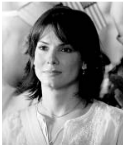
Keanu Reeves es un arquitecto frustrado que encuentra en el buzón de su nueva casa una nota de la anterior inquilina, Sandra Bullock, una doctora de vida aislada.