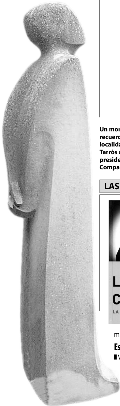
Un monumento recuerda en la localidad del Tarròs al ex presidente Lluís Companys.

La pequeña localidad de El Tarròs recibirá hoy a decenas de personas en la tradicional ofrenda floral frente al monumento a Lluís Companys, original de este pueblo del Urgell, con motivo del 66 aniversario de su fusilamiento a manos del franquismo. Cada año son varios los personajes políticos que se acercan hasta El Tarròs para participar en el homenaje, pero también se encuentran entre los asistentes familiares del último presidente de la Generalitat Republicana y numerosos vecinos de Tornabous, municipio al que pertenece El Tarròs, y de toda la comarca.