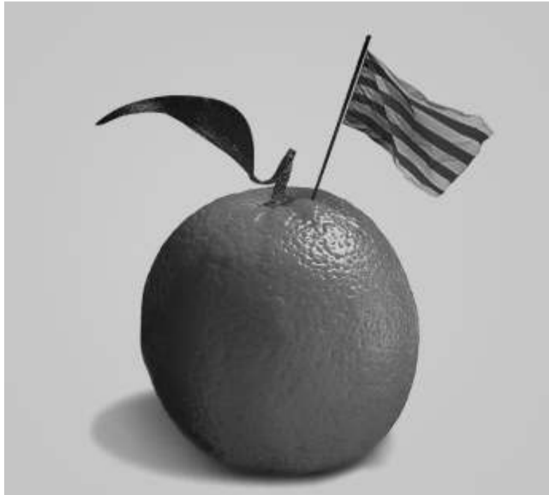
Imatge de la portada del llibre.