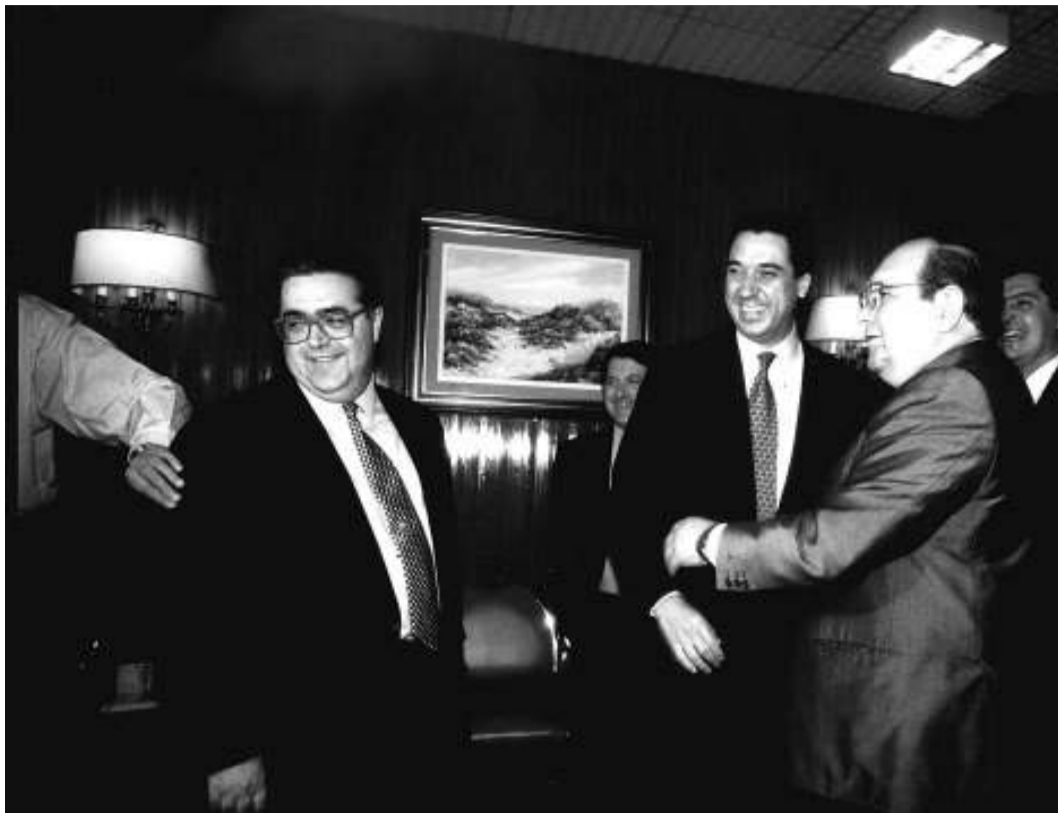
Eduardo Zaplana i Vicente González Lizondo en una reunió per negociar el pacte de govern (o «pacte del pollastre») que va portar el primer a la presidència de la Generalitat Valenciana en 1995.